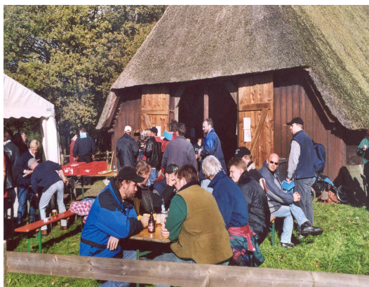
Mittagspause am Schafstall in Riepshof